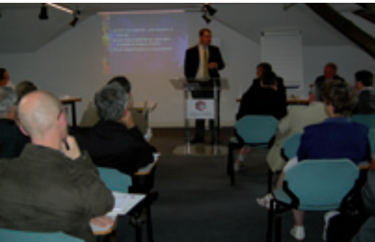
« La responsabilité civile et pénale du dirigeant » lors de la conférence du 16 juin.

De nombreuses obligations pèsent sur les épaules du dirigeant. Placé en toutes circonstances dans une situation à risques, il peut voir sa responsabilité juridique engagée à tout moment, sans toujours en avoir conscience, tant l'environnement législatif et réglementaire dans lequel il évolue est fourni et complexe.