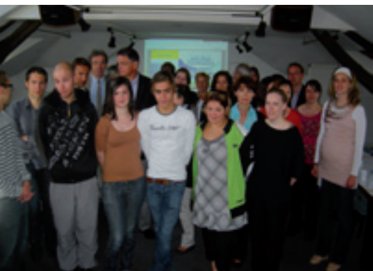
Apprentis, professionnels et membres du club Alternance 61, le 16 juin à la CCITA.

Depuis plusieurs années, de nombreux acteurs locaux collaborent ensemble à