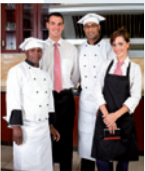
L'hôtellerie ornaise recherche du personnel qualifié