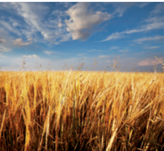
Dans l'Orne, le nombre d'emplois agricoles s'est stabilisé entre 2001 et 2008

Comme tous les ans, la Chambre d'agriculture de l'Orne a publié en mars le rapport 2010 : « L'année agricole dans l'Orne. »