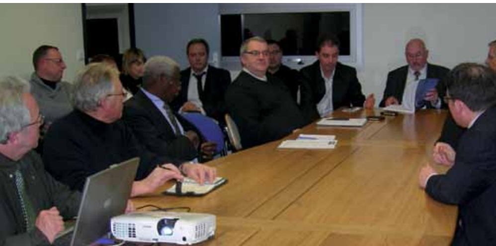
Les chefs d'entreprise qui intègrent un réseau ont la possibilité d'échanger avec les autres vers un objectif commun. Ici, une réunion des DCF Orne.

Pour un chef d'entreprise, adhérer à un réseau permet, avec un minimum d'implication, de rencontrer, échanger, apprendre sur des thématiques diverses. La CCI d'Alençon est partie prenante dans une dizaine de clubs ou groupements.