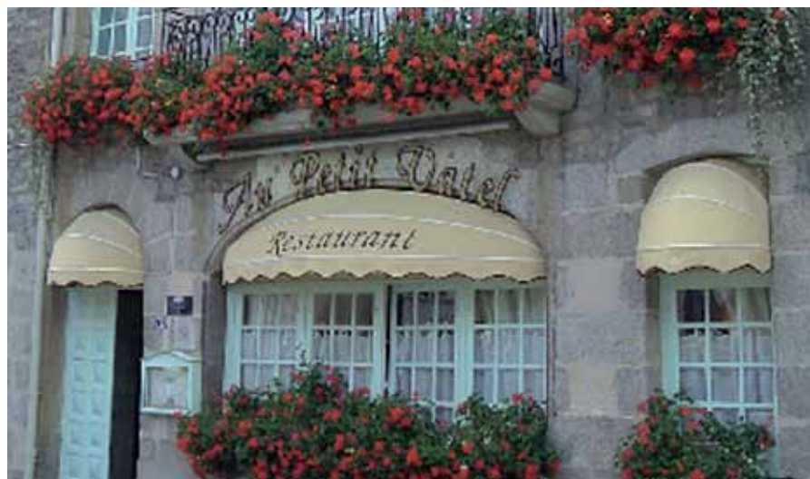
« Au Petit Vatel » est également labellisé Normandie Qualité Tourisme depuis 2001.