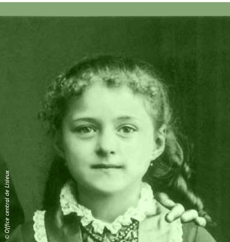
Sainte Thérèse à l'âge de 8 ans. Plus tard, elle deviendra sainte Thérèse de l'Enfant-Jésus et de la Saint-Face.

Célèbres en leur temps ou illustres aujourd'hui, près de 300 personnages hors du commun, et souvent attachants, sont évoqués dans cet ouvrage, qui constitue en quelque sorte une vitrine des domaines d'excellence du département. Chacun, à sa manière, a fissé un peu de la richesse du patrimoine départemental, contribuant ainsi à l'éclosion d'une véritable culture ornaise.