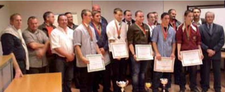
Le métier de boucher assure de belles opportunités de carrière aux jeunes apprentis.

Le 13 octobre a eu lieu la remise des diplômes aux apprentis de la section boucherie du 3IFA-CMFAO. Une occasion de rappeler que le métier, dont l'image a beaucoup évolué, offre de belles perspectives de carrière.