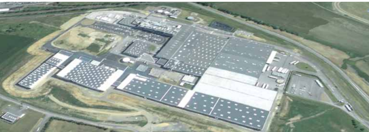
L'usine du Theil-sur-Huisne profite de la proximité de l'eau, mais pâtit du fait d'être quelque peu excentrée.

L'installation au Theil-sur-Huisne de SCA Hygiène Products, à l'époque Abadie, remonte à près de 150 ans. L'usine emploie à présent 330 salariés sur le site, pour une production qui s'est bien diversifiée au fil des années.